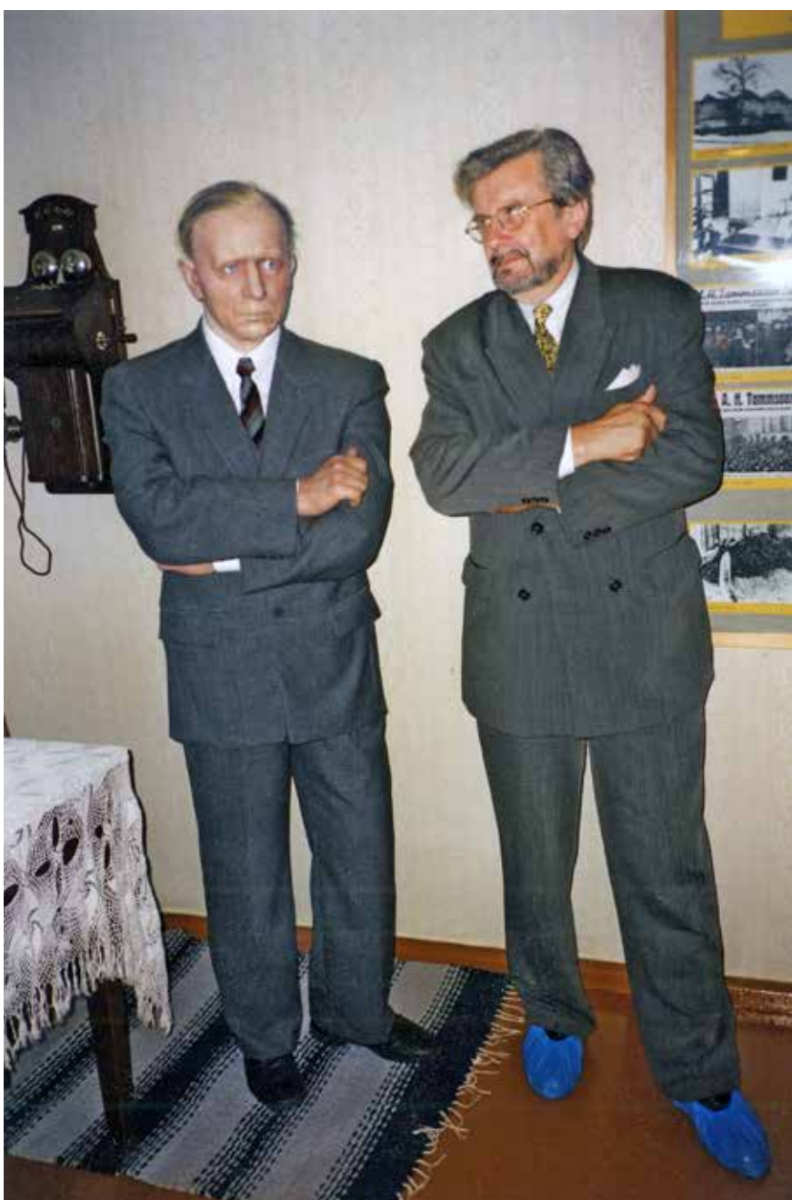
Kirjailija ja kääntäjä vakavassa keskustelussa kansalliskirjailija A. H. Tammsaaren toisessa kotimuseossa, hänen synnyinkodissaan Albussa Pohjois-Virossa. Kääntäjä on Iihaa, kirjailija vahaa.

Ja vielä: suomalaisten Viro-suhteissa toteutui juuri alkaessani suuri sukupolvikatkos, kun sotia edeltävä, maan ensimmäisen itsenäisyyden aikainen suomalaisten estofilien piiri alkoi