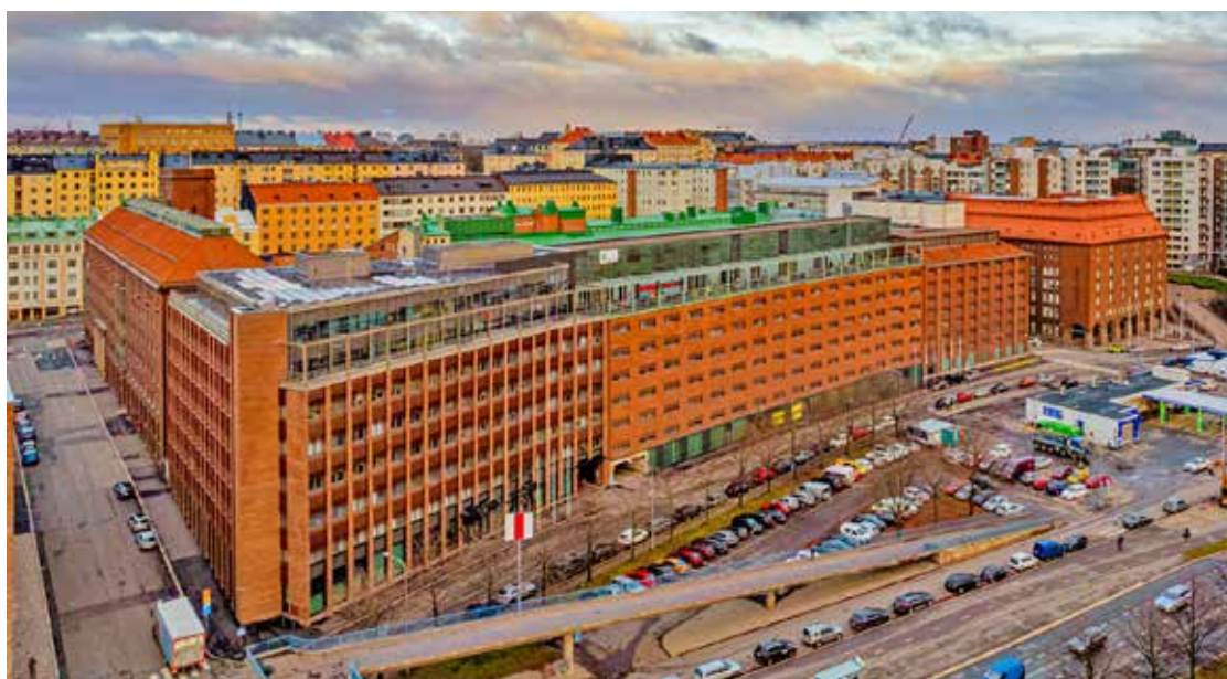
Digi- ja väestötietoviraston Helsingin toimipaikka osoitteessa Lintulahdenkuja 2, Helsinki.

Kirjoittaja toimii julkisena notaarina Digi- ja väestötietovirastossa (DVV) ja on auktorisoitujen kääntäjien tutkintolautakunnan jäsen.